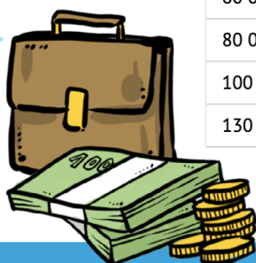
Efekt navrhovaných opatření na výpočet čisté mzdy